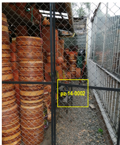
Foto No. 3. Vista general del pozo.